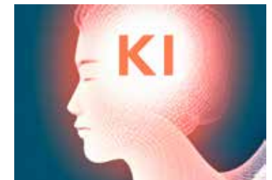
Diese Grafik wurde von der KI DALL-E erstellt